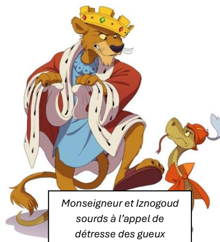
Monseigneur et Iznogoud sourds à l'appel de détresse des gueux

Un manque de suivi des agents, pas de réunion de synthèse, pas de notation depuis son arrivée : Est-ce que cela ne montre pas le mépris total pour notre travail et notre engagement au quotidien ?